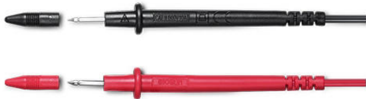
CAT II 600V 10A表筆